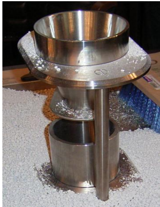
Schüttdichtemessung für Streugut

Die Probenziehung fand ausschließlich vor Ort statt. Spezielle Schüttdichtemessungen nach DIN ISO 697 (s. Foto rechts) für Streugüter erfolgten auch in den dafür ausgestatteten Labors der regionalen Dienststellen, sofern dies vor Ort nicht möglich war.